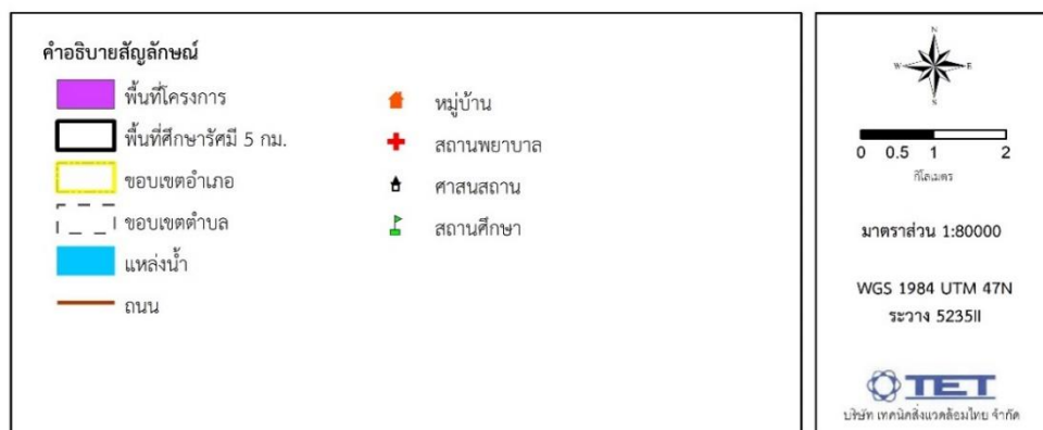
รูปที่ 1.2-1 ที่ตั้งโครงการ